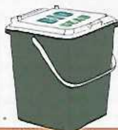
Un bio-seau pour transporter vos déchets de cuisine jusqu'au composteur